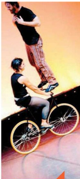
ACROBATICI Gli acrobati del circo El Grito in scena al Teatro Vittoria fino a domenica 3 maggio

Una sintesi fra danza e teatro con musica dal vivo a ritmi swing e jazz