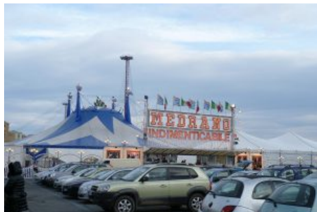
Gli esterni del Circo Medrano