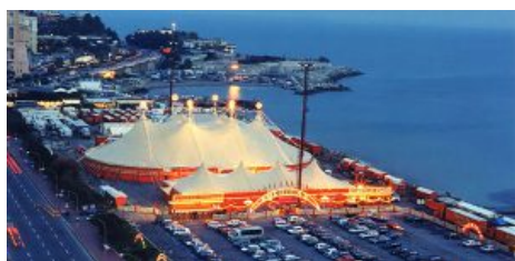
Il tendone dell'American Circus affacciato sul mare di Genova